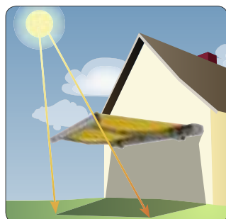
Aukšta saulė Pvz.: pietinė pusė

Pavėsis po markize žinoma priklauso nuo saulės padėties ir markizės suregulavimo kampo. Kai saulė yra žemiausiai arba vakarų pusėje, patartina sureguliuoti markizę mažesniu kampu (markizės priekis arčiau žemės). Kitas būdas - reguliuojamo ilgio vertikaliai išskleidžiamas lambrekenas.