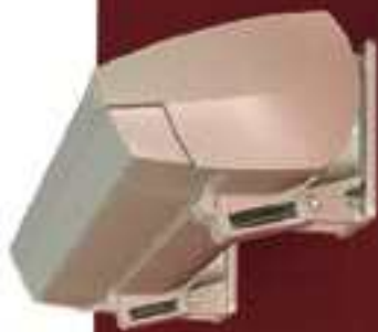
Montavimas prie sienos

Išskleidžiamas markizes paprasta sumontuoti. Jas galima montuoti prie sienos, ant lubų ar net ant gegnių. Galimi tvirtinimo būdai prie apšiltintų ar kitokių fasadų.