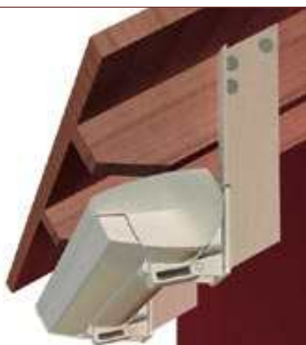
Montavimas prie gegnių

Paprastai tik sertifikuoti specialistai turi teisę įrengti WO&WO produktus. Jei ši sąlyga yra nevykdoma, Jums negali būti suteikiama įstatymu numatyta dviejų metų garantija.