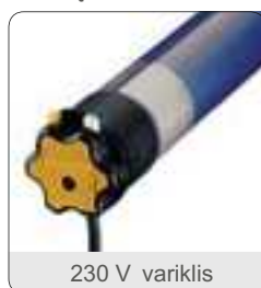
230 V variklis

Kai kalbama apie markizių valdymą, TOPLINE modeliams yra ką pasiūlyti. Šios markizės kaip ir daugelis kitų markizių yra valdomos rankiniu būdu, tačiau viską galima supaprastinti naudojant elektrinį variklį, kuris valdomas distancinio pulto pagalba.