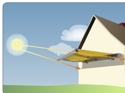
Žema saulė Pvz.: vakarinė pusė